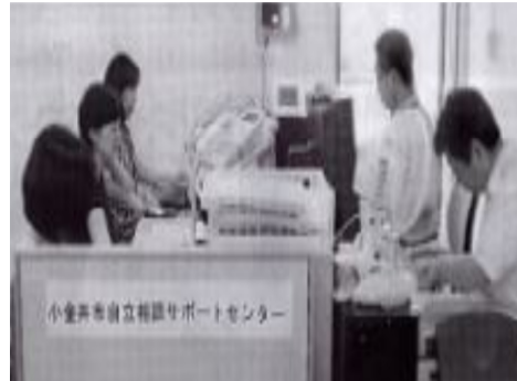
4月1日より小金井市自立相談サポートセンター開始

これは市の行政や財政を改革するための市としての指針・方針=「大綱を決める参考として行ったアンケートの結果をまとめたもので、直近の市民の意識・意向を示すものとして注目される。今回は特に「財政再建」を軸に取り上げたい。報告の3で「今後市が進めるべき行革の方向性」を問われた回答で最も多かったのは「財政の健全化に向けた取組」で「そう思う」と「まあそう思う」で72.6%にもなる(複数回答可)。しかも市民の多くは問11で(財政危機下の)行政サービスのあり方の回答では「現状の財源の中で、行政サービスの質や量を見直すべきで