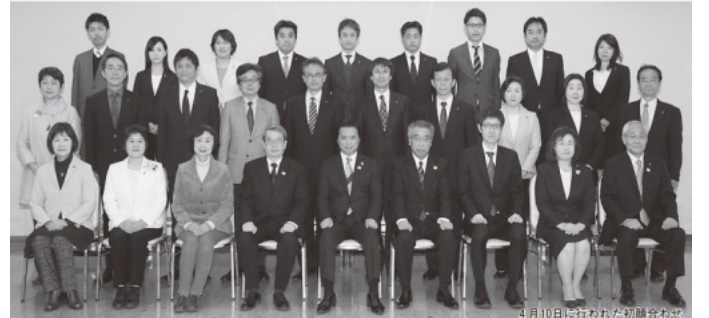
平成29年4月10日、市議選後の初顔合わせ (『市議会だより』から)

非正規雇用などの女性の方が選挙候補に擁立しやすい側面もあるだろう。それを利用した政党の数合わせのための候補者も残念ながらいるようだ。解雇と雇用が