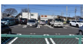
東小金井駅北口まちづくり事業用地

なお、「障害のある人もない人も共に学び共に生きる社会を目指す小金井市条例」や、「職員の給与に関する条例の一部を改正する条例(市職ボーナスを他多摩25市同様に4.5カ月に改正)の議決が注目される。