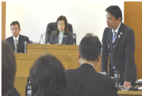
2月25日、日曜議会で答弁する西岡真一郎市長