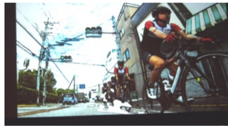
小金井市内を走るロードバイク。PR映像より。

一年後に迫った東京2020オリンピック。その自転車競技ロードレースの通過自治体となった多摩8市(小金井市・府中市・調布市・三鷹市・稲城市・多摩市・八王子市・町田市)は合同連絡会を設置。11日に共同記者会見を行った。