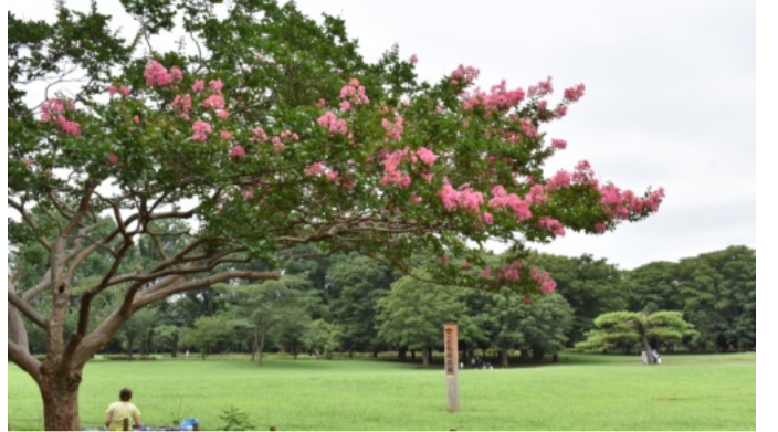
咲き始めたサルズベリ(7月30日、小金井公園こどもの広場で)

一番の問題は、大量の郵送申請が届いてから、体制の見直しまでに約3週間がかかったこと。また、申請書到着日に対する振り込み予定日が市ホームページにも掲載がなかったため市民の不安が増大。しかしその間、西岡真一郎市長から情報発信はなかった。問題点を総括し、今後に生かす努力が市には求められている。