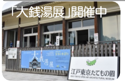
江戸東京たてもの園で9月27日まで

本 町2丁目の焼き鳥店「竜の字」で7月24日、火災が発生。近隣住民は「大量の煙と入口から出る炎に周囲は騒然となった。消防車の到着が思いのほか遅く感じた」と話していた。二階建て店舗は全焼したが人がいなかった。