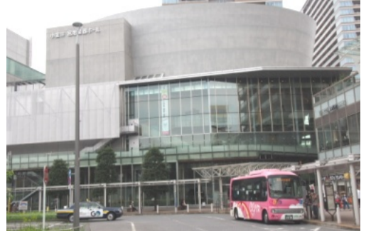
宮地楽器ホールは保健センターに比べて交通の便が良いため、より積極的な接種が期待できる

市は武蔵小金井駅前の大規模接種会場(旧西友小金井店=9月5日まで)に加え、11日から貫井北町の保健センターで12歳以上の市民を対象に集団接種を再開。ツイッターなどSNSから予約枠の空き状況をこまめに知らせ、「飛び込み予約」にも対応している。