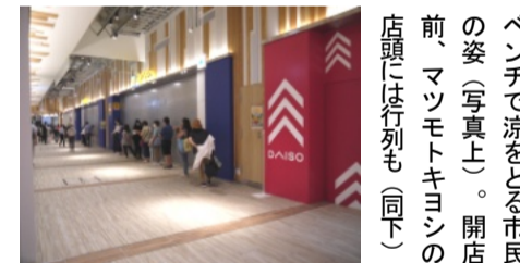
ベンチで涼をとる市民の姿(写真上)。開店の前、マツモトキヨシの店頭には行列も(同下)

小金井市医師会はコロナワクチン接種に関して、市の予約システム上はいつでも医療機関に直接電話すれば予約可能な医療機関もあると呼びかけている。大規模接種会場のキャンセル待ちも含め、まずは市のコールセンター(042-316-7666)へ。