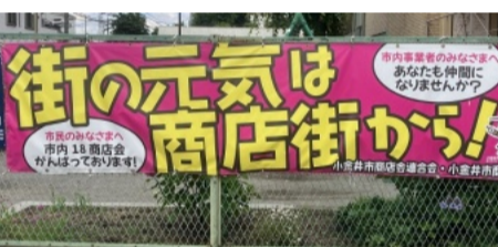
商店会連合会や商工会も商店会会員を募る

小金井市の催しが続々と再開されている。夏恒例の「小金井阿波おどり大会」は秋の開催を決定。現在準備中だ(右記事参照)。公民館や図書館の催しも感染対策を講じながら再開されている。