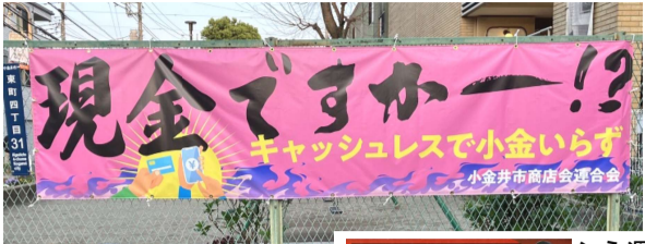
小金井市内で見かける横断幕

発行：市民運動新聞編集委員会 電話：042-383-6611 FAX：042-383-3031 〒184-0011東京都小金井市東町4-38-26 トーケンプラザB1F http://shimin-undo-np.jp/