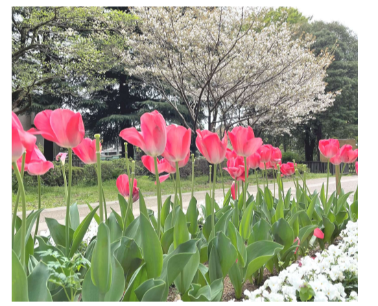
小金井公園では、散りゆく桜を背景に満開に咲き誇るチューリップが見頃だ。正門口から中央部へ延びる中央園路沿いの長い花壇は、ボランティアの「小金井公園 花の会」が協働で手入れを行っている。

おことわり 本紙 編集委員・佐野浩のコラムは、筆者の体調不良のため休載しました。