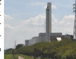
4月で本格稼働5年目を迎える可燃ごみ処理施設

ればなくなる可能性がある」と注意を呼びかけている。焼却炉を持たない小金井市もごみ処理で重大な影響を受ける。 3市の市長は市民や事業者にごみ出しルールの徹底を求めている。また3市は今年31日まで水銀使用製品(水銀体温計/温度計/血圧計)及び容器に入った水銀を回収し、持参した市民に粗品(小金井は電子体温計またはエコバックなど)を贈呈するキャンペーンも実施。水銀製品が可燃ごみに混入しないよう徹底したい。