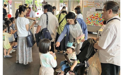
8、9日に小金井 宮地楽器ホールで開催された「キッズカーニバルKOGANEI2024」。ステージでのダンスやゲーム大会のワークショップなど多彩な催しが行われ多くの子どもたちが訪れた。(画像一部を加工)

経済面だけでない少子化の側面 内閣府の「少子化社会に関する国際意識調査」(2021年)によると、「子どもを生み育てやすいと思う」との回答は38.3%。フランスは82.0%、ドイツは77.0%で、その数値差は衝撃的だ。「理想の子ども数をもたない理由」は「子育てや教育にお金がかかりすぎるから」がトップで52.6%。現在政府が推し進める「異次元の少子化対策(少子化対策関連法)」を