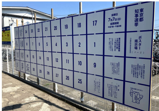
小金井市 期日前投票/市役所第二庁舎 21日(金)~7月6日(土) 8:00~20:00、前原町西之台会館 7月2日(火)・3日(水) 9:00~20:00、マロンホール 7月4日(木)・5日(金) 9:00~20:00